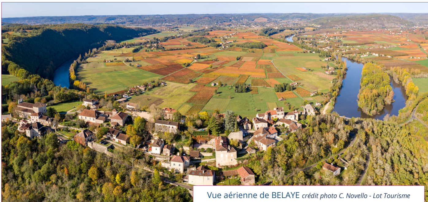
Vue aérienne de BELAYE