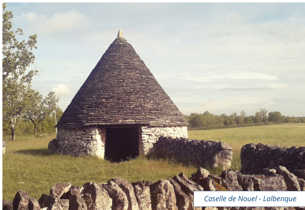
Caselle de Nouel - Lalbenque